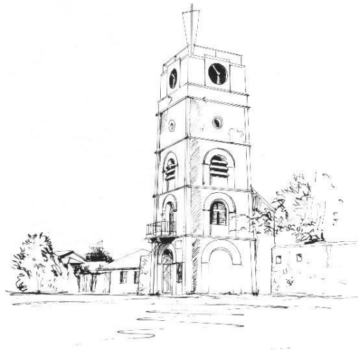
Fort Zoutman, Aruba

Fort Zoutman dankt haar bestaan aan de beslissing van het Militair Comité om de havens van de Benedenwindse Eilanden te beschermen, evenals Fort Nassau op Curaçao als Fort Oranje op Bonaire. Fort Zoutman kwam gereed in 1796. Begin 19 e eeuw ontwikkelde zich hier, bij de Paardenbaai, Oranjestad. Het fort werd genoemd naar Schout-bij-nacht Johan Arnold Zoutman. Fort Zoutman maakte twee acties mee. De eerste keer in 1799 toen het Engelse oorlogsschip ‘Surprise’ onaangekondigd de Paardenbaai binnenvoer. De eilandelijke commandant vreesde moeilijkheden. Toen hij zag dat een boot werd neergelaten gaf hij opdracht om te schieten. Een man werd gedood en de Engelsen verdwenen zo snel al mogelijk was. De tweede keer was in 1805 toen Aruba was bezet door de Engelsen en een bevrijdings expeditie vanuit