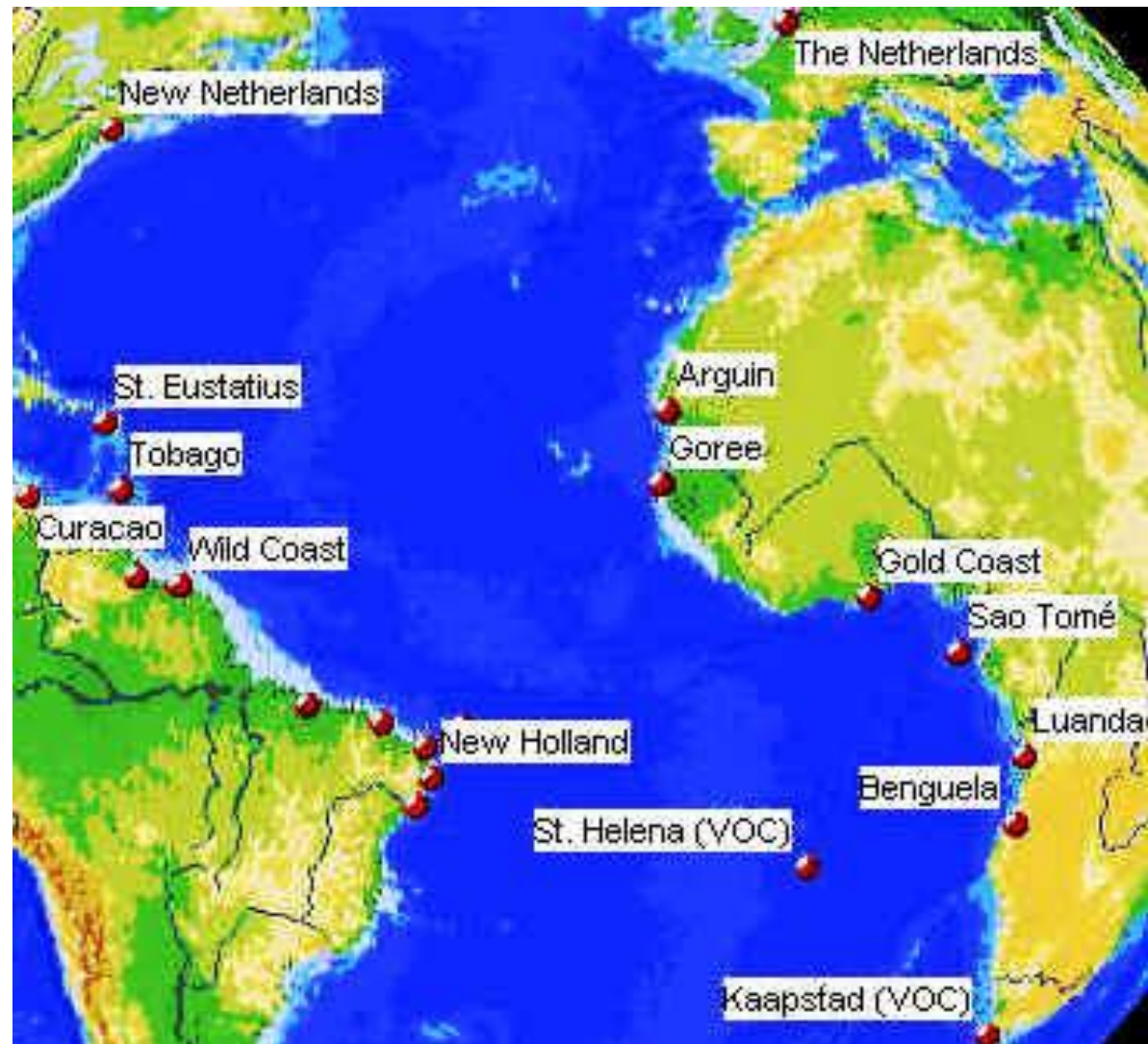
Handelsplaatsen van de West Indische Compagnie in 1650

De verovering van Pernambuco en aangrenzende gebieden werd in 1634 gevolgd door de inname van Curaçao, Aruba en Bonaire, waar de daar gevestigde Spaanse kolonisten, slechts gering in getal, weinig tegenstand boden. Omstreeks 1640 werd het Amerikaanse bezit van de WIC nog uitgebreid met de verovering van Sint Eustatius en Saba. De heren XIX voorzagen een ruilhandel tussen het 'Nieuw-Holland' gedoopte Pernambuco en 'Nieuw-Nederland' met Curaçao als tussenstation. Naar Nieuw-Nederland dienden blanke kolonisten gezonden te worden die het landbouwkarakter van deze kolonie zouden versterken. Nieuw-Holland was voorbestemd om suiker, tabak en verfhout te produceren met uit Afrika aangevoerde arbeidskrachten.