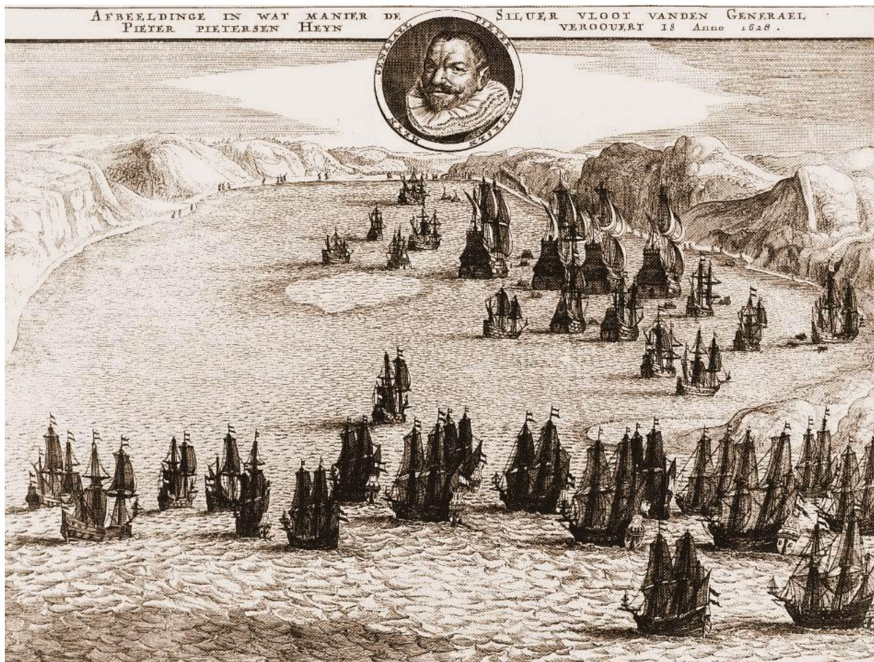
Piet heyn verovert de Spaanse Zilvervloot tijdens de Slag in de Baai van Matanzas (Cuba) in 1628