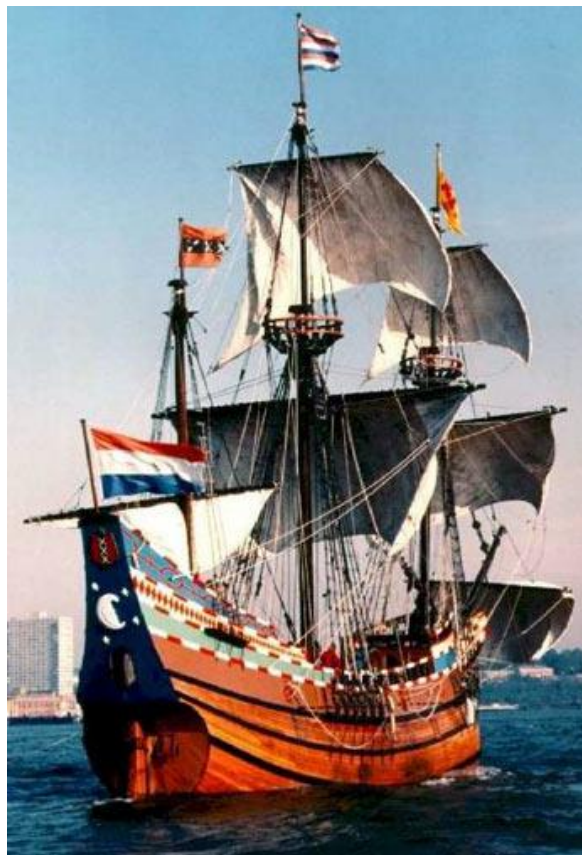
Replica van het WIC schip "Halve Maen"

de Westindische eilanden hadden eveneens een groeiende behoefte aan gedwongen werkkrachten.