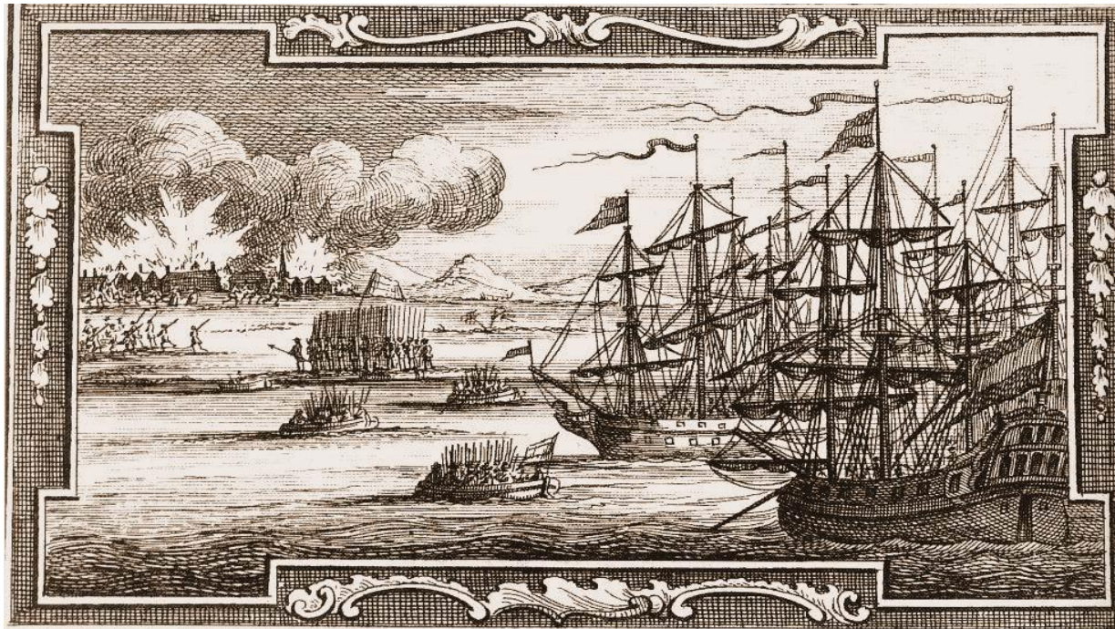
Verovering van Curaçao door Johannes van Walbeeck in 1634