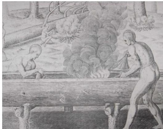
Zo ging het maken van de Cayuco in z'n werk

Toch bestond er ook enig onderling contact tussen de eilanden. Er wordt verondersteld dat de rode verfstof, benodigd voor versiering van inheems aardewerk, van Aruba werd aangevoerd naar Curaçao. Voorwerpen van steensoorten, die op Aruba wel, maar op Curaçao niet voorkwamen, werden bij Knip gevonden.